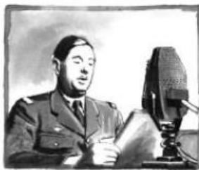
Général de Gaulle

C'est librement que je me suis rendu à l'invitation du Führer . Je n'ai subi de sa part aucune pression. Une collaboration a été envisagée entre nos deux pays. J'en ai accepté le principe. Ainsi, dans un avenir proche, pourrait être allégé le poids des souffrances de notre pays. L'armistice, au demeurant, n'est pas la paix. La France est tenue par ses obligations nombreuses vis-à-vis du vainqueur. Cette politique est la mienne. Suivez-moi. Gardez votre confiance en la France éternelle.