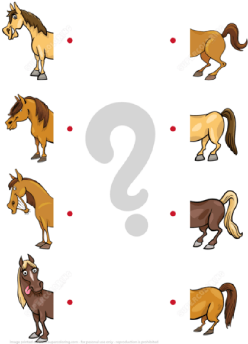
Image printed on www.supercoloring.com - for personal use only - reproduction is prohibited

Retrouve la moitié correspondant à chaque cheval.