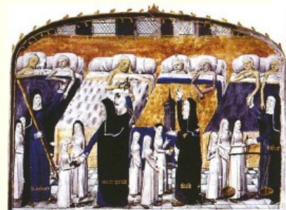
Le soin aux pauvres et aux malades (hôpital)