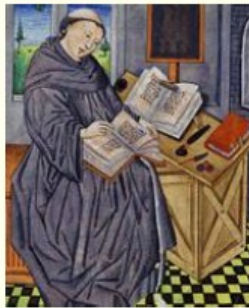
Le moine recopie la Bible

La diffusion du savoir est encadré par l'église car les livres autorisés sont recopiés par les moines.