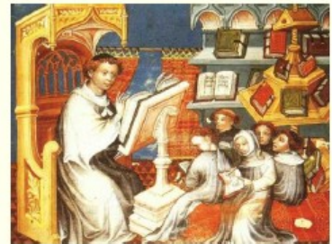
Le leçon de lecture