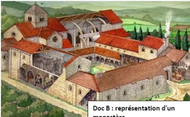
Doc B : représentation d'un monastère

Langley, Andrew. Vivre au Moyen Âge . Gallimard, 2002. Les yeux de la découverte.