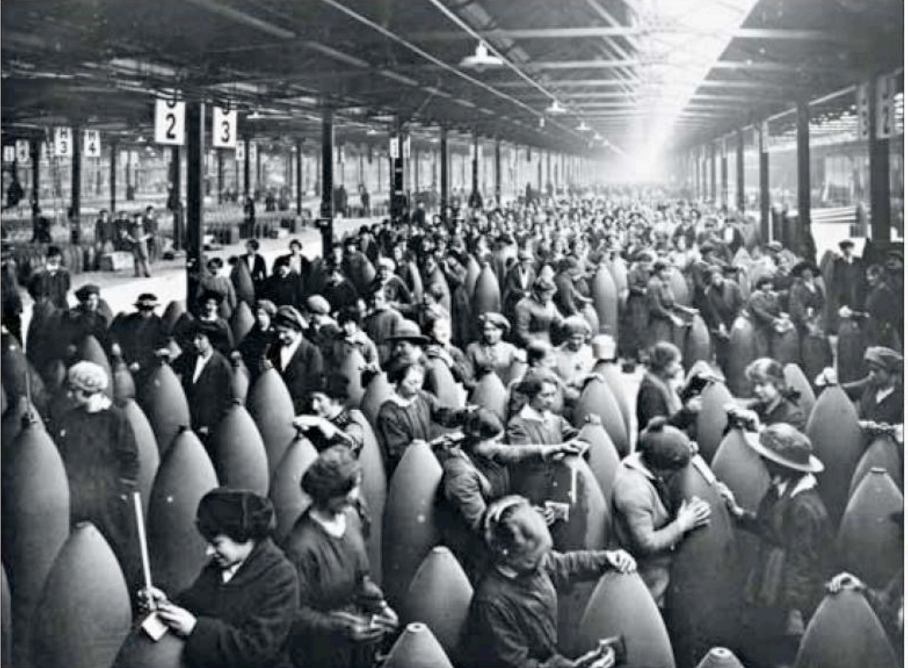
Ouvrières dans une usine en Angleterre pendant la guerre